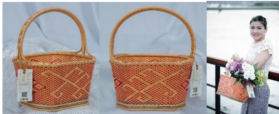
ภาพ 4 ตะกร้าหวายลายเถาวัลย์ของกลุ่มหัตถกรรมจักสานจากหวายกลุ่มผู้สูงอายุตำบลจิ้ว อำเภอเทิง จังหวัดเชียงราย