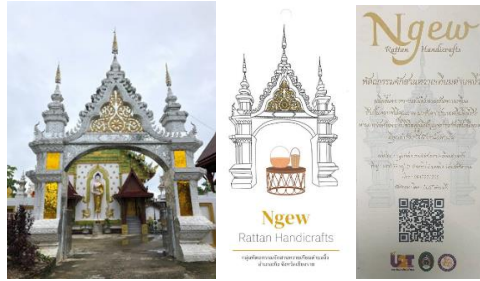
ภาพ 3 ลวดลายเครื่องเถาขุ่มประตูดบญเย็น หมู่บ้านสักกลางพัฒนา ตำบลจิ้ว อำเภอเทิง จังหวัดเชียงราย