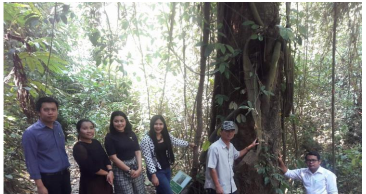
ภาพที่ 2 ป่าชุมชนบ้านป่าซางวิวัฒน์ เป็นป่าที่มีต้นไม้ขนาดใหญ่หลากหลายชนิด รวมไปถึงพืชสมุนไพรต่างๆ ซึ่งได้มีการสำรวจข้อมูลและทำป้ายชื่อพันธุ์ไม้สำหรับผู้ที่สนใจศึกษาและเพื่อเป็นส่วนหนึ่งของการสร้างเส้นทางท่องเที่ยวเชิงนิเวศ

2) การทำแนวกันไฟ พื้นที่ป่าชุมชนบ้านป่าซางวิวัฒน์ที่อยู่ในการดูแลรักษาของผู้นำชุมชนและชาวบ้านภายใต้การส่งเสริมและสนับสนุนจากเทศบาลตำบลนางแล โดยอาสาสมัครป้องกันไฟป่าของชุมชน ทำให้ป่ายังคงความอุดมสมบูรณ์ตลอดทั้งปีและไม่มีปัญหาไฟป่า สิ่งหนึ่งที่เป็นตัวบ่งชี้ให้เห็นว่าพื้นที่ป่าชุมชนบ้านซางวิวัฒน์นั้นไม่ถูกไฟป่าเผาทำลายเหมือนกับพื้นที่อื่นคือ สภาพความอุดมสมบูรณ์ของต้นไม้ที่สูงใหญ่และเขียวชอุ่มตลอดทั้งปี ป้ายชื่อพันธุ์ไม้ที่มีการนำไปปักไว้ใกล้กับต้นไม้ในป่าเพื่อบ่งบอกชื่อพันธุ์ไม้ชนิดต่างๆ ไม่ถูกไปเผาทำลายในห้วงระยะเวลา 4 ปีที่ผ่านมา นอกจากนี้ยังมีระบบการบริหารจัดการไฟป่าโดยศูนย์อาสาป้องกันไฟป่าตำบลนางแล ซึ่งมีการอบรมให้ความรู้เพื่อเตรียมความพร้อมป้องกันและดับไฟป่าแก่ประชาชนในพื้นที่ และทุกครั้งที่มีการขอความร่วมมือในการทำแนวกันไฟก็จะได้รับการตอบรับจากชาวบ้านเป็นอย่างดี