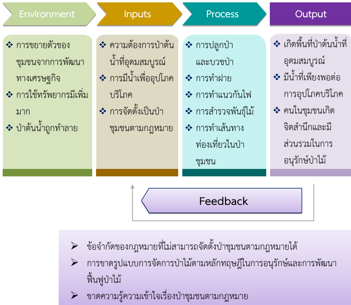
ภาพที่ 4 ผลการศึกษาโดยการวิเคราะห์ผ่านทฤษฎีระบบของ David Easton ประกอบด้วย Inputs, Process, Output และ feedback

ทฤษฎีระบบของ David Easton อธิบายได้ว่าการขยายตัวของชุมชนอันเป็นผลพวงมาจากการพัฒนาทางเศรษฐกิจทำให้การใช้ทรัพยากรมีเพิ่มมากขึ้นโดยเฉพาะทรัพยากรป่าไม้และที่ดินทำกิน การใช้ทรัพยากรโดยปราศจากการควบคุมของชาวบ้านป่าซางวิวัฒน์ (ช่วงก่อนปี พ.ศ. 2517) ส่งผลให้ป่าต้นน้ำถูกทำลายปริมาณน้ำที่ได้จากป่าเพื่อการอุปโภคบริโภคมีไม่เพียงพอ จากสภาพแวดล้อมดังกล่าวนำไปสู่ความต้องการสร้างและพัฒนาป่าต้นน้ำที่อุดมสมบูรณ์ตลอดจนการมีน้ำเพื่ออุปโภคบริโภค และการจัดตั้งเป็นป่าชุมชนตามกฎหมาย สำหรับกระบวนการจัดการป่าชุมชนของสมาชิกในชุมชนบ้านป่าซางวิวัฒน์ที่เกิดขึ้นนั้นได้แก่ การปลูกป่าและบวชป่า การทำฝาย การทำแนวกันไฟ การสำรวจพันธุ์ไม้ และการทำเส้นทางท่องเที่ยวในป่าชุมชน ผลลัพธ์ที่ได้คือ เกิดพื้นที่ป่าต้นน้ำที่อุดม