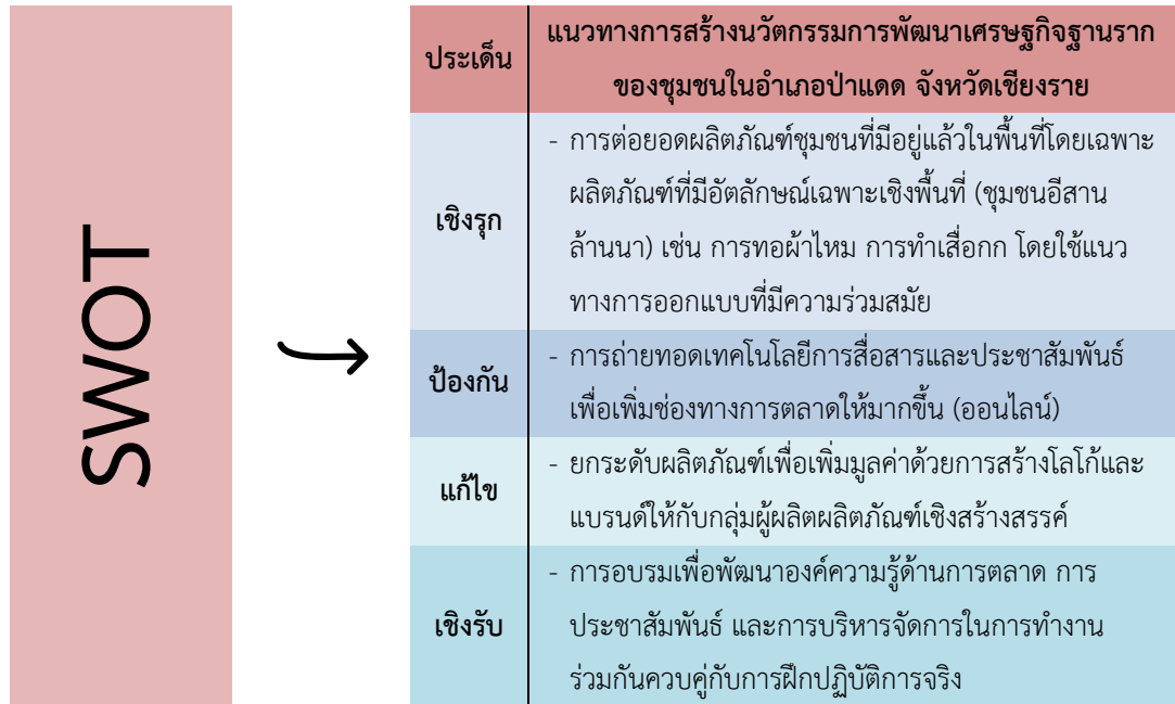
ภาพที่ 2 สรุปแนวทางการสร้างนวัตกรรมการพัฒนาเศรษฐกิจฐานรากของชุมชนในอำเภอป่าแดด จังหวัดเชียงราย

ขั้นตอนที่จะนำไปสู่การปฏิบัติจริง และการประเมินผลที่ได้จากการพัฒนาต้นแบบ เพื่อนำไปสู่การเรียนรู้และการพัฒนาตนเอง ซึ่งสรุปได้ดังภาพที่ 2