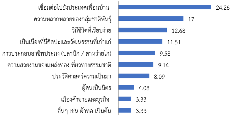
ภาพที่ 2: ภาพลักษณ์ของการท่องเที่ยวอำเภอเชียงใหม่

เป็นเมืองที่มีความหลากหลายของกลุ่มชาติพันธุ์ (ร้อยละ 17) และมีวิถีชีวิตที่เรียบง่าย (ร้อยละ 12.68) ตามลำดับ